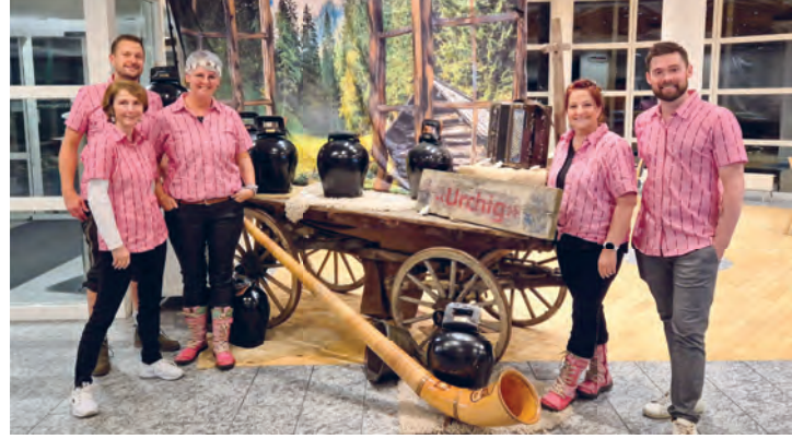
Team der Jahresmottogruppe

Der Personalabend bietet nicht nur Raum für Freude und Geselligkeit, sondern auch für Rückblick, Dank und die Ehrung langjäh-